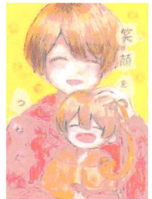
第12回(令和4年度) 中学生以上の部 優秀作品

皆さんの声を聞かせてください “エールぎふ”総合相談 ☎0120-43-7830