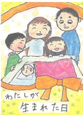
第12回(令和4年度) 小学生以下の部 最優秀作品

岐阜市では、子ども虐待防止啓発のため、「オレンジリボン」を描いた「絵てがみ」を募集します。「家族の絆」や「親子のふれあい」をテーマに、心温まる作品をぜひ、ご応募ください。