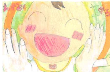
第12回(令和4年度) 小学生以下の部 優秀作品