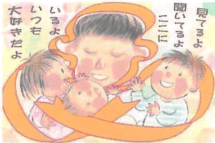
第12回(令和4年度) 中学生以上の部 最優秀作品